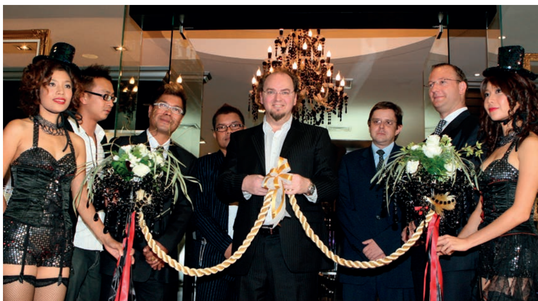
Inauguration du salon de Bangkok en 2006