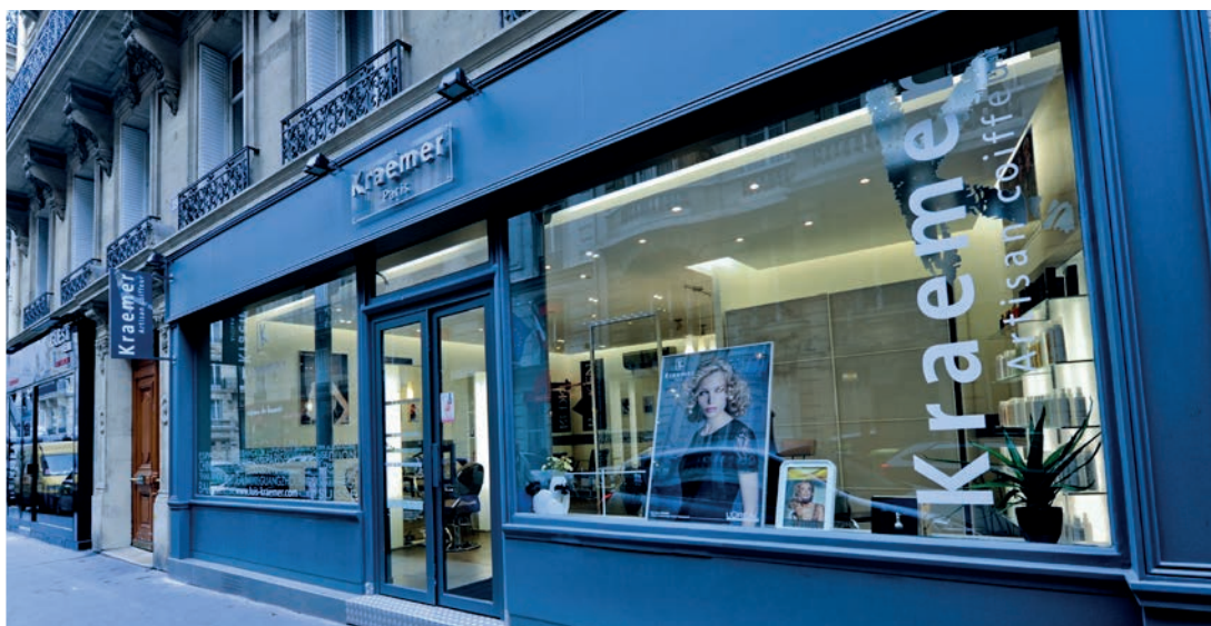
Salon Kraemer Paris 17e